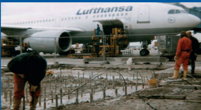
Lotnisko Frankfurt nad Menem