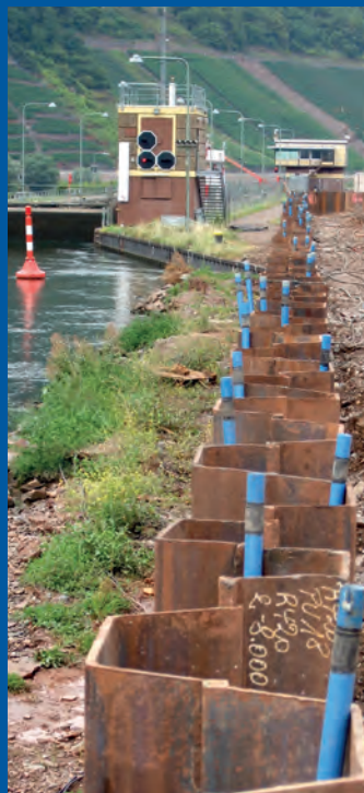
Śluza na Mozeli