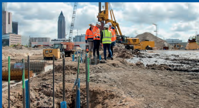
Nowa hala targowa 12, Kompleks Targowy Frankfurt nad Menem