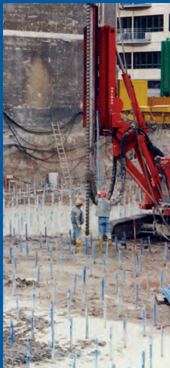
Wykop Potsdamer Platz, Berlin