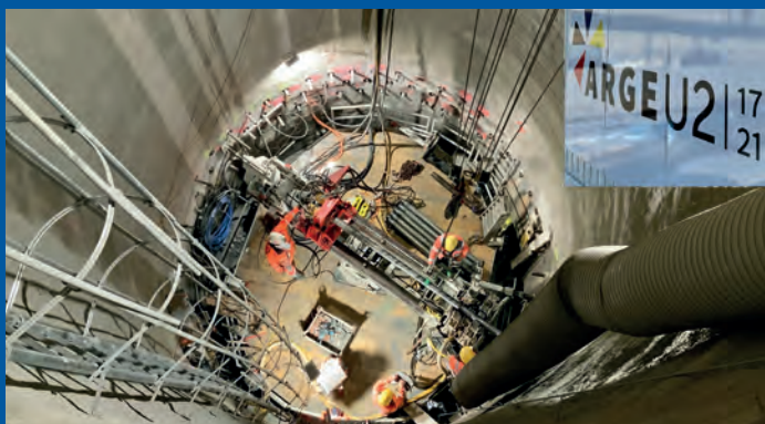
Arge U2, budowa Metra, Wiedeń