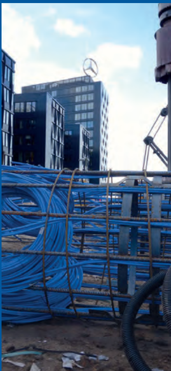
Wykop budowlany Max & Moritz, Berlin