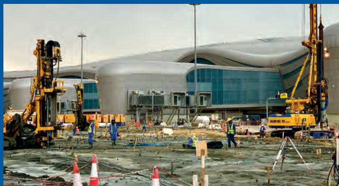
Lotnisko Abu Dhabi