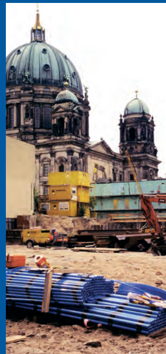
Muzeum Pergamońskie, Berlin